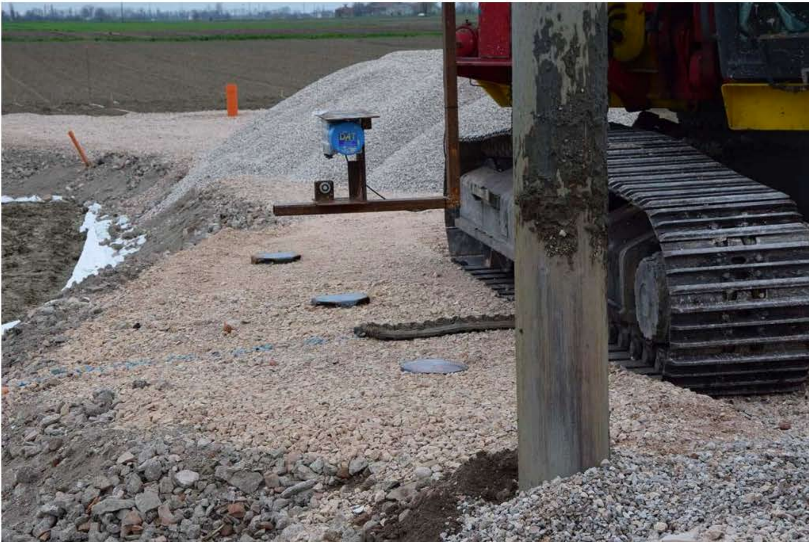
Pali in ghiaia per la riduzione del potenziale di liquefazione dei terreni. Posa. Realizzazione.

Verifica sperimentale in ambiente controllato e definizione di criteri di progettazione per interventi per la mitigazione del fenomeno di liquefazione nei terreni, con particolare riferimento alla tecnica del deep mixing.